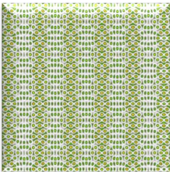
Aperiodicna Matjeova rešetka

U okviru izrade ovih tema student/studentkinja će se upoznati sa metodom experimentalne realizacije fotonskih rešetki tehnikom optičke indukcije u fotorefraktivnom kristalu, ispitati načine realizacije novih klasa aperiodičnih struktura, ili istraživati efekte propagacije i lokalizacije svetlosti u optički indukovanim fotonskim rešetkama.